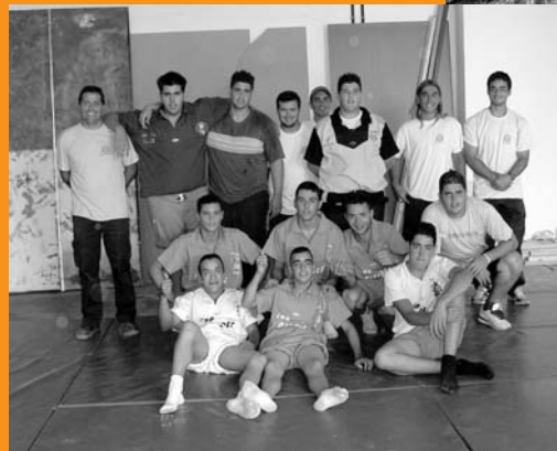
Escuela Taller La Oliva-Puerto del Rosario